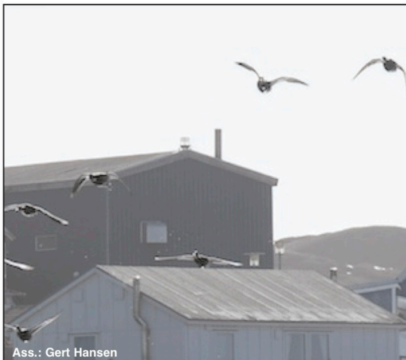
Ass.: Gert Hansen

1. juni 2023 www.kujataamiu.gl • mail: kujataamiu@gmail.com